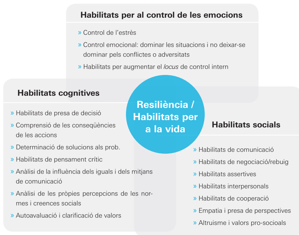
Figura 1: Habilitats per a la vida treballades amb els adolescents

← Elaboració pròpia a partir de Guía de conceptos y pautas de intervención para la incorporación de estrategias de promoción para la salud y de promoción de la resiliencia en adolescentes